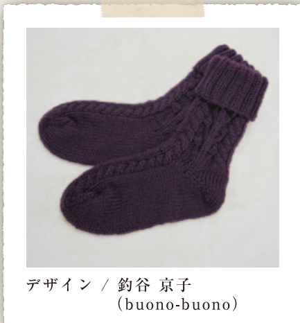
デザイン / 釣谷 京子 (buono-buono)