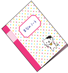
マナちゃんのミニミニサイズのノートです!