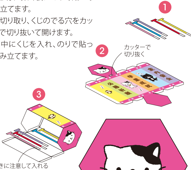
くじの向きに注意して入れる