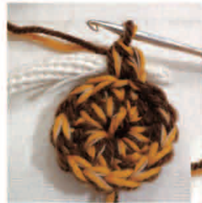
ロープを巻き込みながら編む