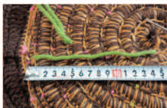
糸を 15cm 程切る