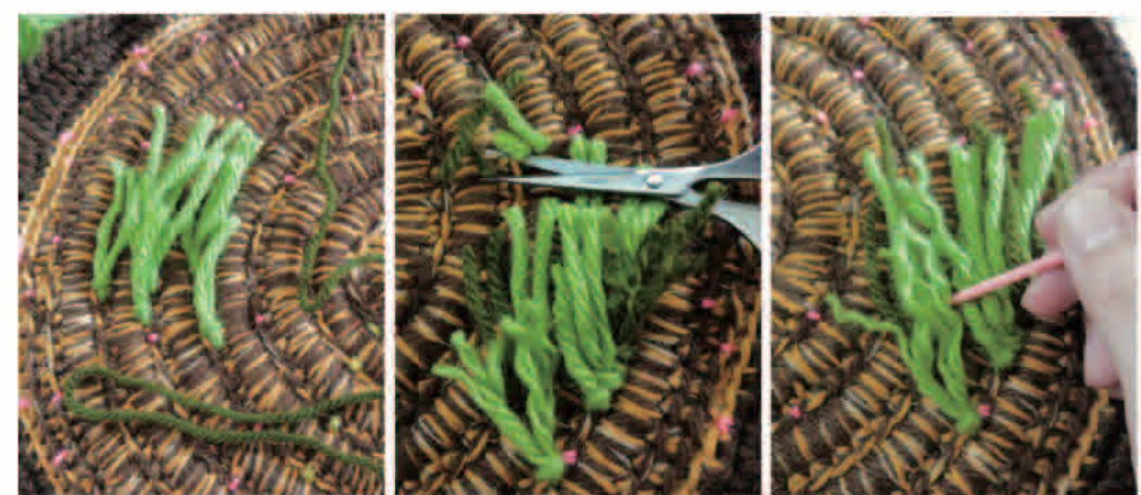
きりかぶ中腹部分にフリンジ付け、長さを適度に揃える、糸をほぐす