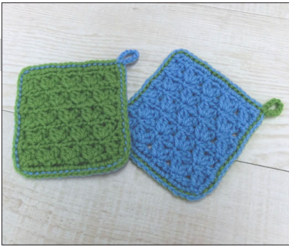
デザイン/金子祥子