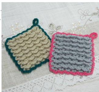
デザイン/金子祥子