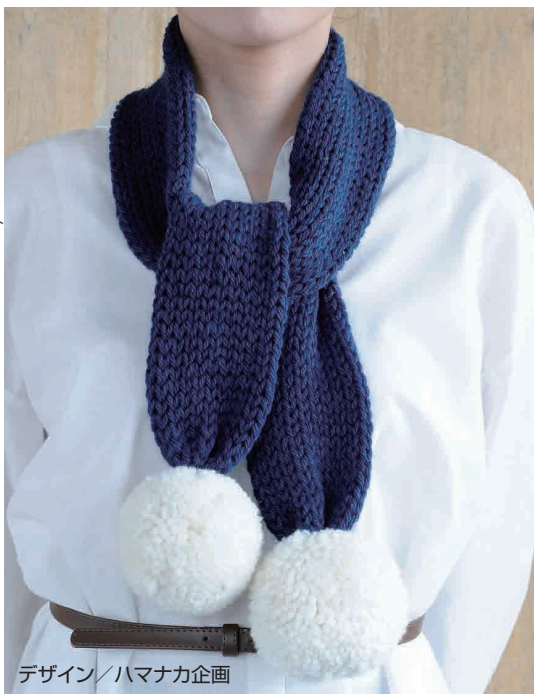
デザイン/ハマナカ企画