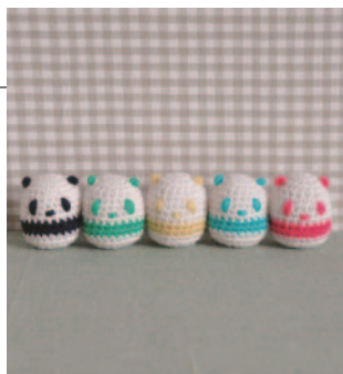
デザイン/いちかわみゆき