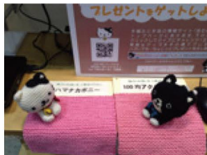
違いの分かるマナちゃん!?