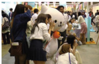
マナちゃんを囲んでパチリ!