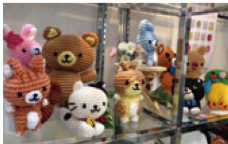
お友だちも大集合!