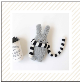
デザイン/ハマナカ企画

使用糸 アメリーエフ《合太》(30g玉巻) ナチュラルホワイト(501)0.2玉、ブラック (524)0.2玉(10g)