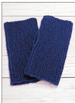
デザイン/ハマナカ企画