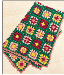
デザイン/岡まり子