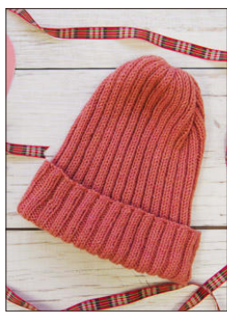
デザイン/ハマナカ企画