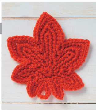
デザイン/城戸珠美