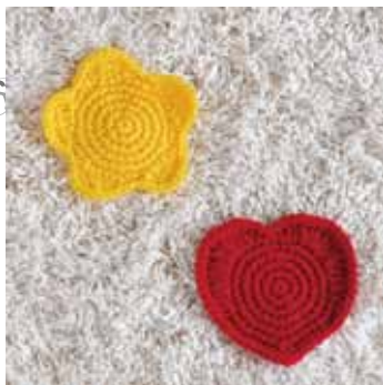
デザイン／ハマナカ企画