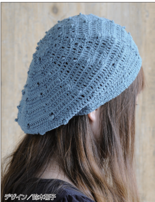
デザイン/鈴木朝子