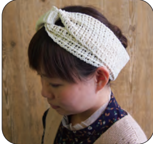
デザイン/松本恵衣子