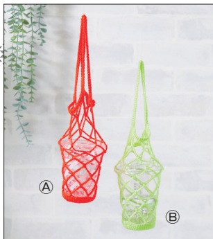
デザイン／ハマナカ企画