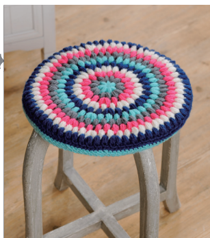
デザイン/ハマナカ企画