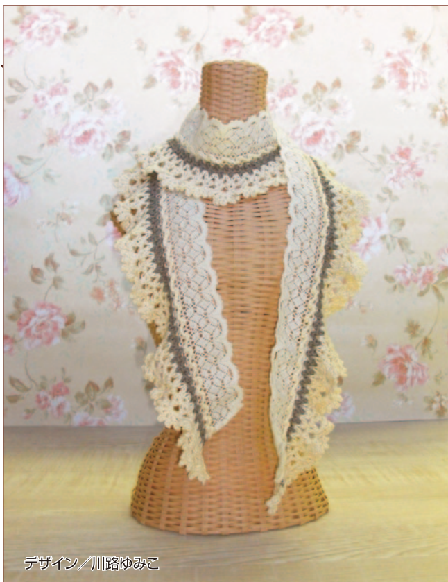
デザイン/川路ゆみこ