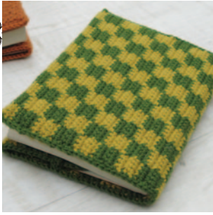
デザイン／ハマナカ企画

☆でき上がり寸法 縦16.5cm、横30cm。 ☆使用糸 コロポックル(25g玉巻)