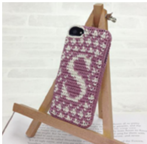
デザイン/ハマナカ企画