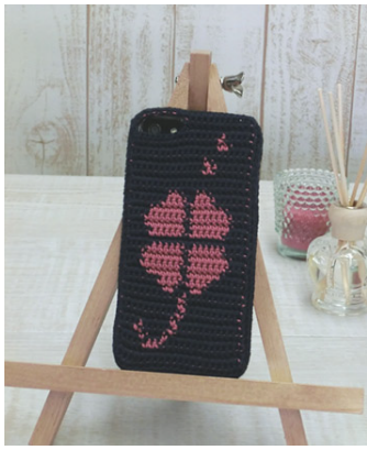
デザイン/ハマナカ企画