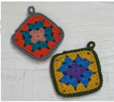
デザイン/金子祥子