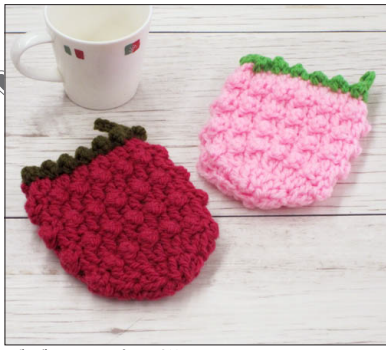
デザイン/金子祥子