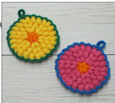
デザイン/金子祥子