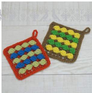
デザイン/金子祥子