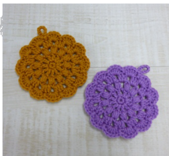
デザイン／金子祥子