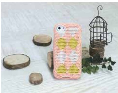
デザイン/ハマナカ企画