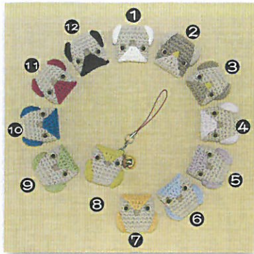
デザイン/齊藤郁子