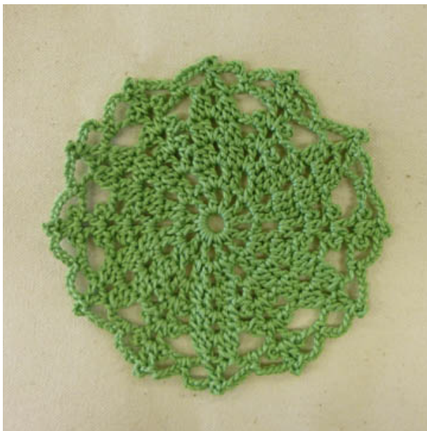
デザイン / chi-sa-ko