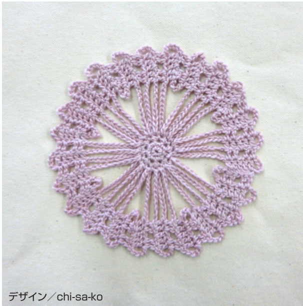
デザイン / chi-sa-ko