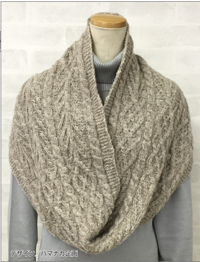
デザイン/ハマナカ企画