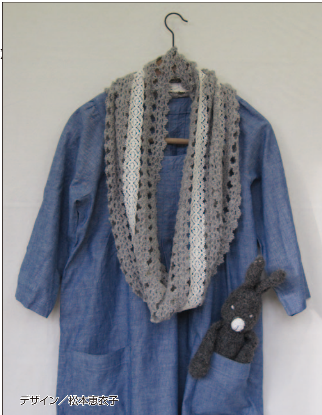
デザイン／松本恵衣子