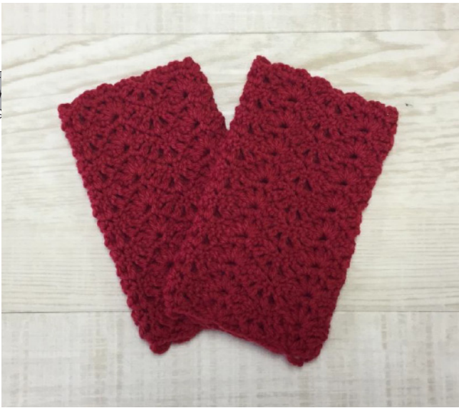
デザイン/ハマナカ企画