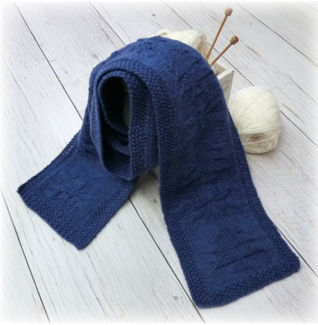
デザイン/河合真弓