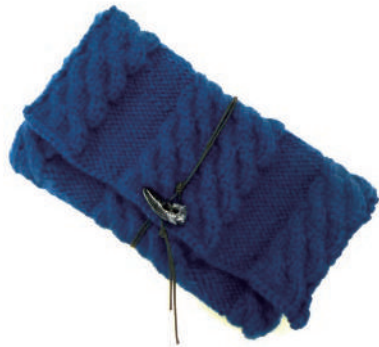
デザイン/ハマナカ企画