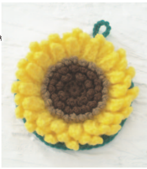
デザイン/城戸珠美