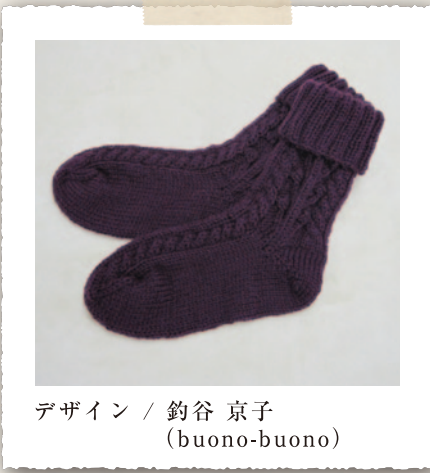
デザイン / 釣谷 京子 (buono-buono)