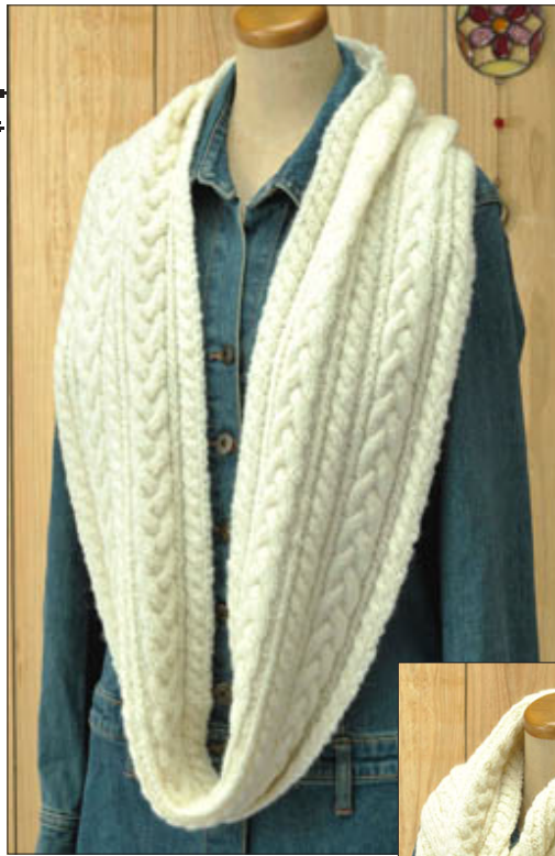
デザイン/ハマナカ企画