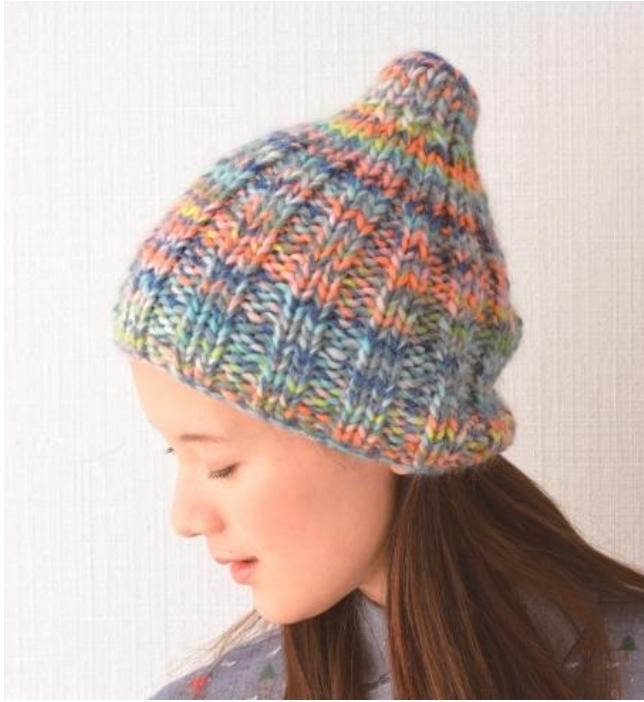
デザイン/岡本啓子