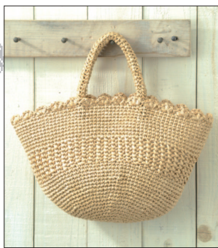
デザイン／橋本真由子