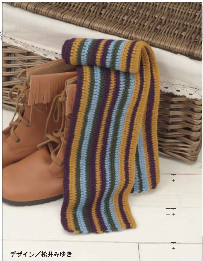
デザイン/松井みゆき